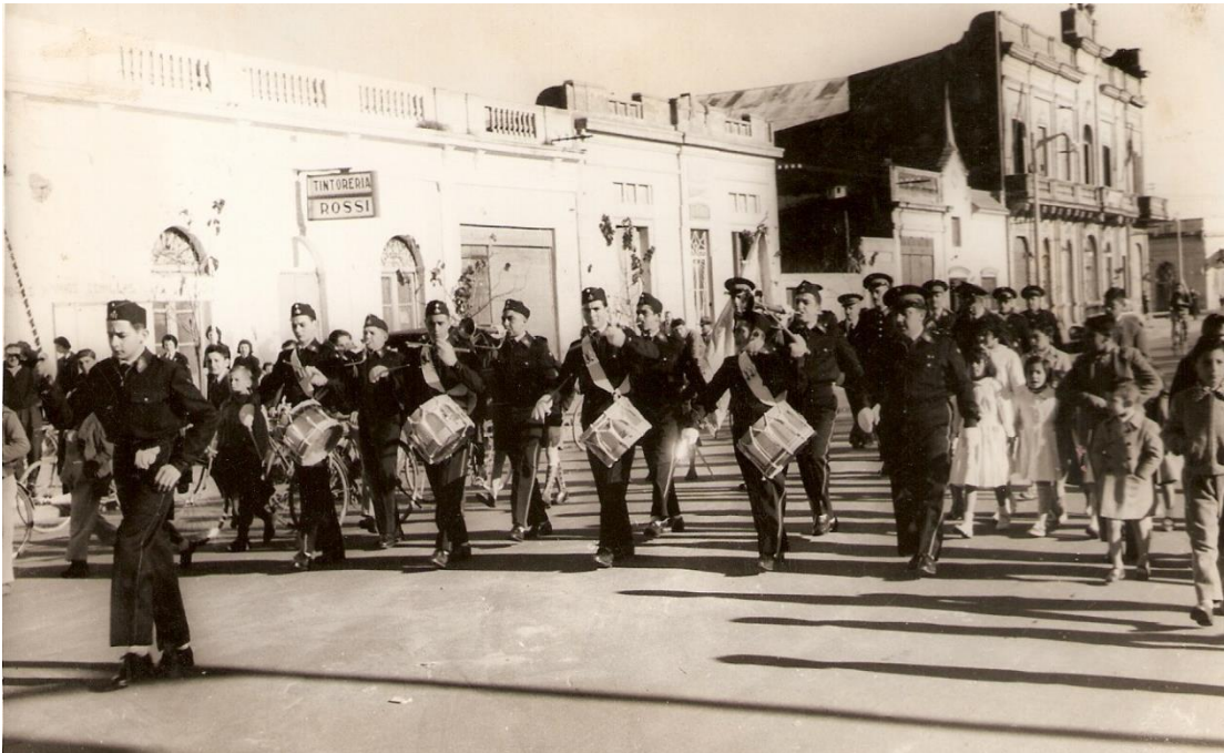
25 de Mayo de 1958 desfile de la Banda Municipal por Avenida Belgrano