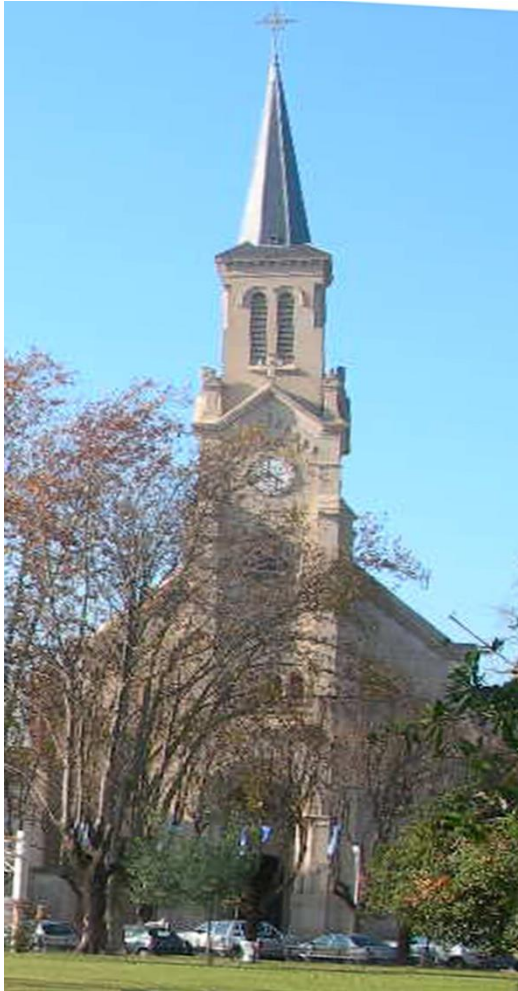
Parroquia Nuestra Señora de la Asunción