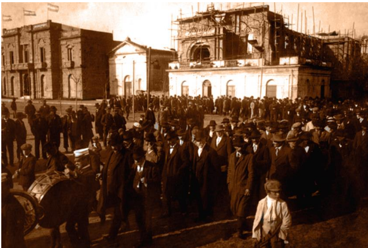
Aquí se observan: la municipalidad, la capilla antigua y la nueva iglesia en construcción, delante de ella la casa parroquial que luego se demolió. Año 1913