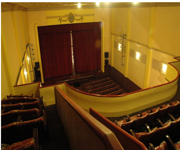
Vista interior 2010